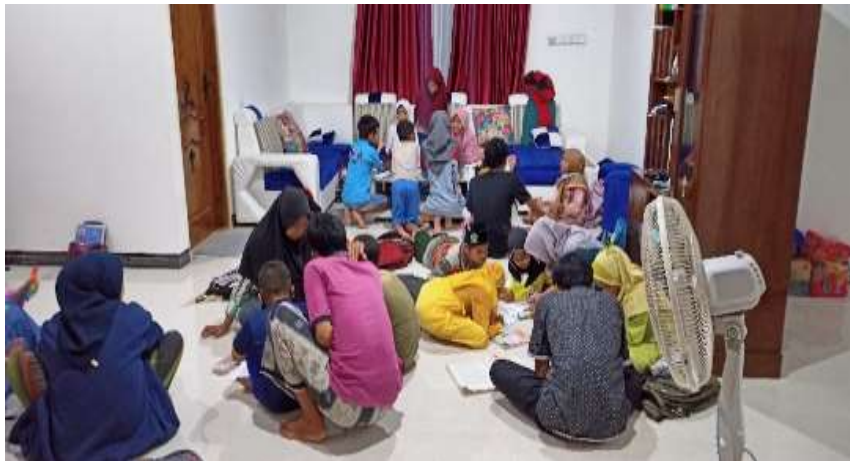
Gambar 3. Proses BIMBEL peserta didik kelas 4A dan 4B MI Ihyauddin