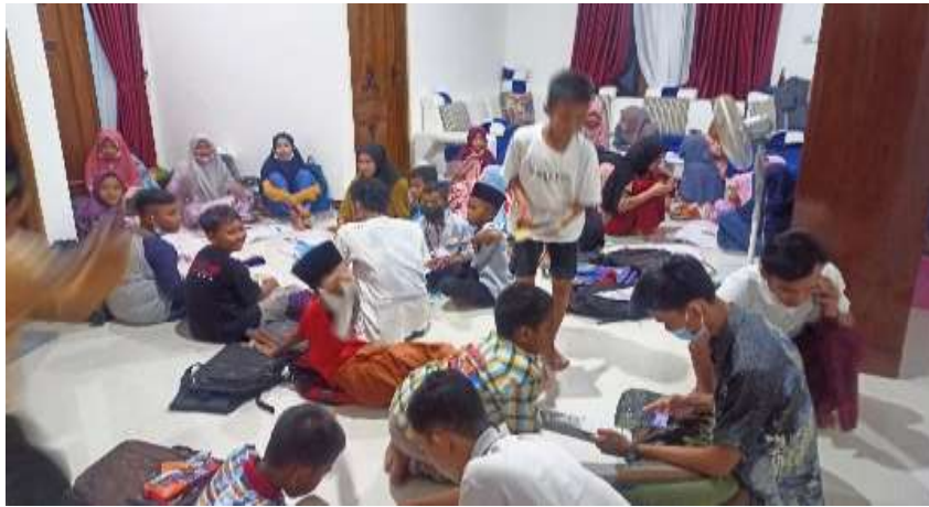
Gambar 2. Proses BIMBEL peserta didik kelas 4B dan 5 MI Ihyauddin

KKN UNISDA beserta anak-anak dan masyarakat Desa Ngayung dalam program bimbingan belajar disajikan pada gambar di bawah.