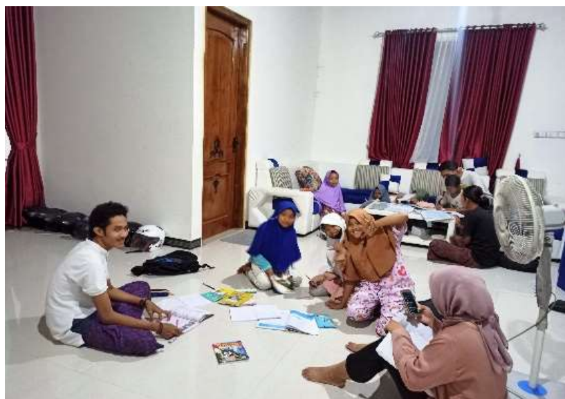
Gambar 4. Proses BIMBEL peserta didik kelas 5 MI Ihyauddin