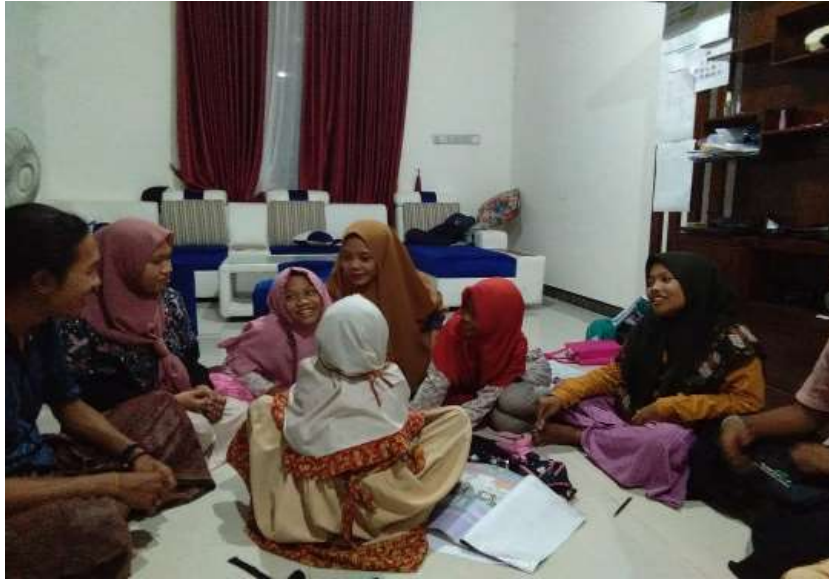
Gambar 5. Proses BIMBEL peserta didik kelas 3 dan 4 SDN Ngayung

Selama program BIMBEL, anak-anak antusias mengikuti setiap kegiatan. Hasil dari BIMBEL ini menunjukkan adanya perubahan positif dalam proses pembelajaran. Permasalahan yang secara umum dialami siswa berkurang yaitu berupa sukar dalam memahami materi yang diberikan oleh guru. Di samping itu, kegiatan ini juga dapat membantu anak-anak yang merasa sulit untuk menyelesaikan latihan-latihan yang didapatkan selama kegiatan belajar di sekolah dan menyediakan forum peran orang tua untuk membantu siswa belajar di rumah.